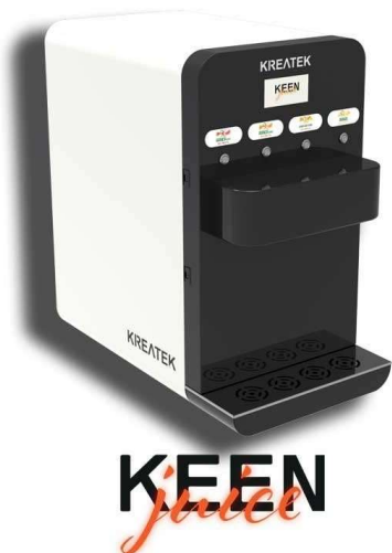
Kreatek Keen 4 succhi erogazione 60 lt/h con caraffa in predose