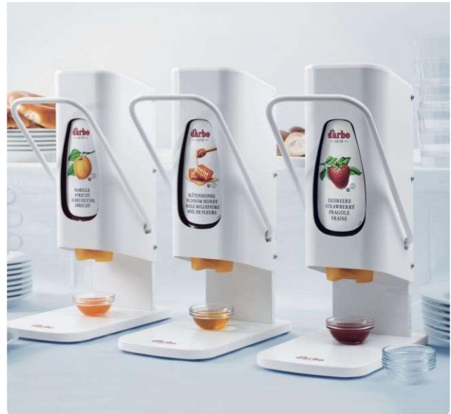
Dispenser marmellate miele e crema nocciola al cacao Darbo