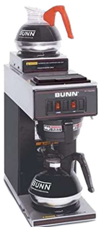
Percolatore Bunn per caffè Americano 100%