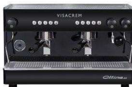
Visacream Ottima 2 bracci