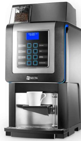
Necta Korinto nella versione solo solubili o caffè in grani più solubili