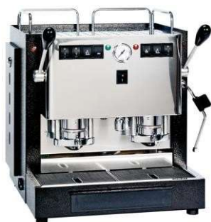
Spinell miniminilux per coffee break Con serbatoio acqua e caffè in cialde