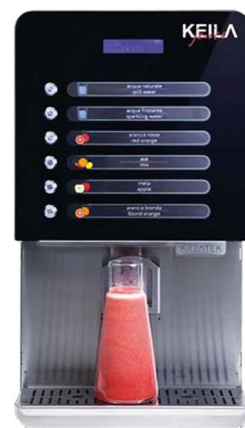
Kreatek Keila 4 succhi più acqua fredda frizzante o liscia