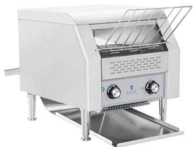
Tostapane a nastro