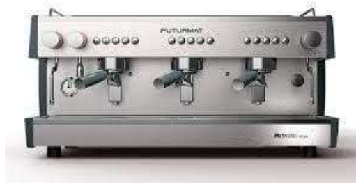
Futurmat 3 bracci