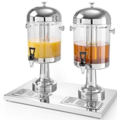
Dispenser succo in policarbonato da buffet