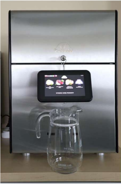
Puremix Connect 3 Gusti