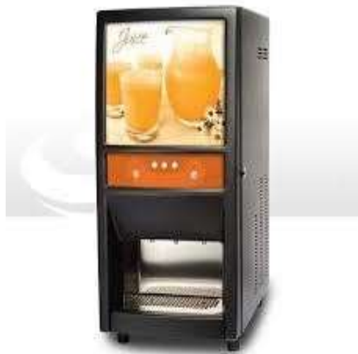
Spm Big Juice Black 2 succhi