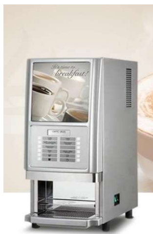
Spm Breakfast 4 solubili versione grigia o versione nera