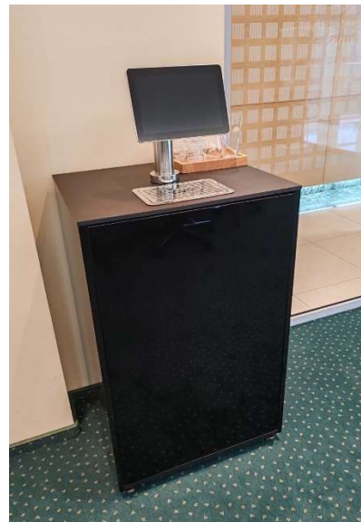
Tower 3 gusti disponibile anche nelle versioni Connect e Vario