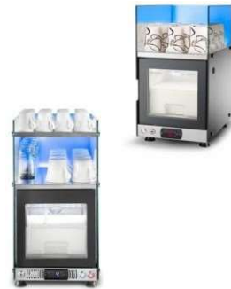
Necta kalea caffè in grani più due solubili con frigo e scalda tazze per latte liquido