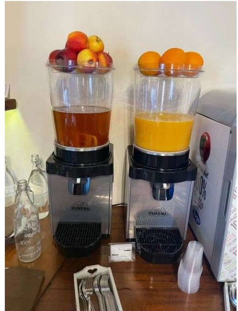
Frigo miscelatore per succhi e spremute gelo