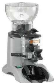
Macina caffè mod CT1 Gaggia da 1 kg