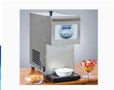
Yogurtiera a 3 gusti in abbinamento alle nostre polpe di frutta o mono gusto