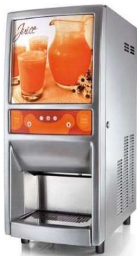
Spm Big Juice Grey 2 succhi più acqua fredda liscia