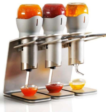
Dispenser marmellate miele e crema nocciola al cacao Menz & Gasser