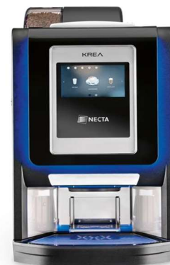
Necta Krea touch caffè in grani più tre solubili