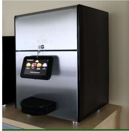
Puremix Vario 3 Gusti