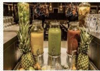
Dispenser succo in Vetro da buffet