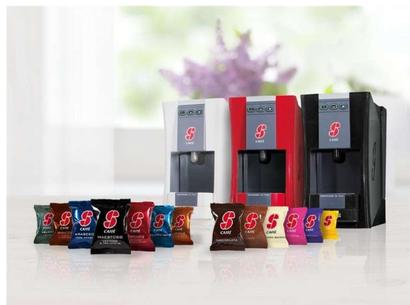
Macchine a capsule per suite e camere