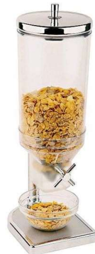
Dispenser di cereali