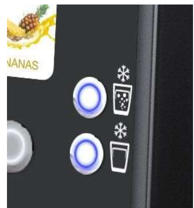
h.81 x larg.38,5 x prof.63 cm